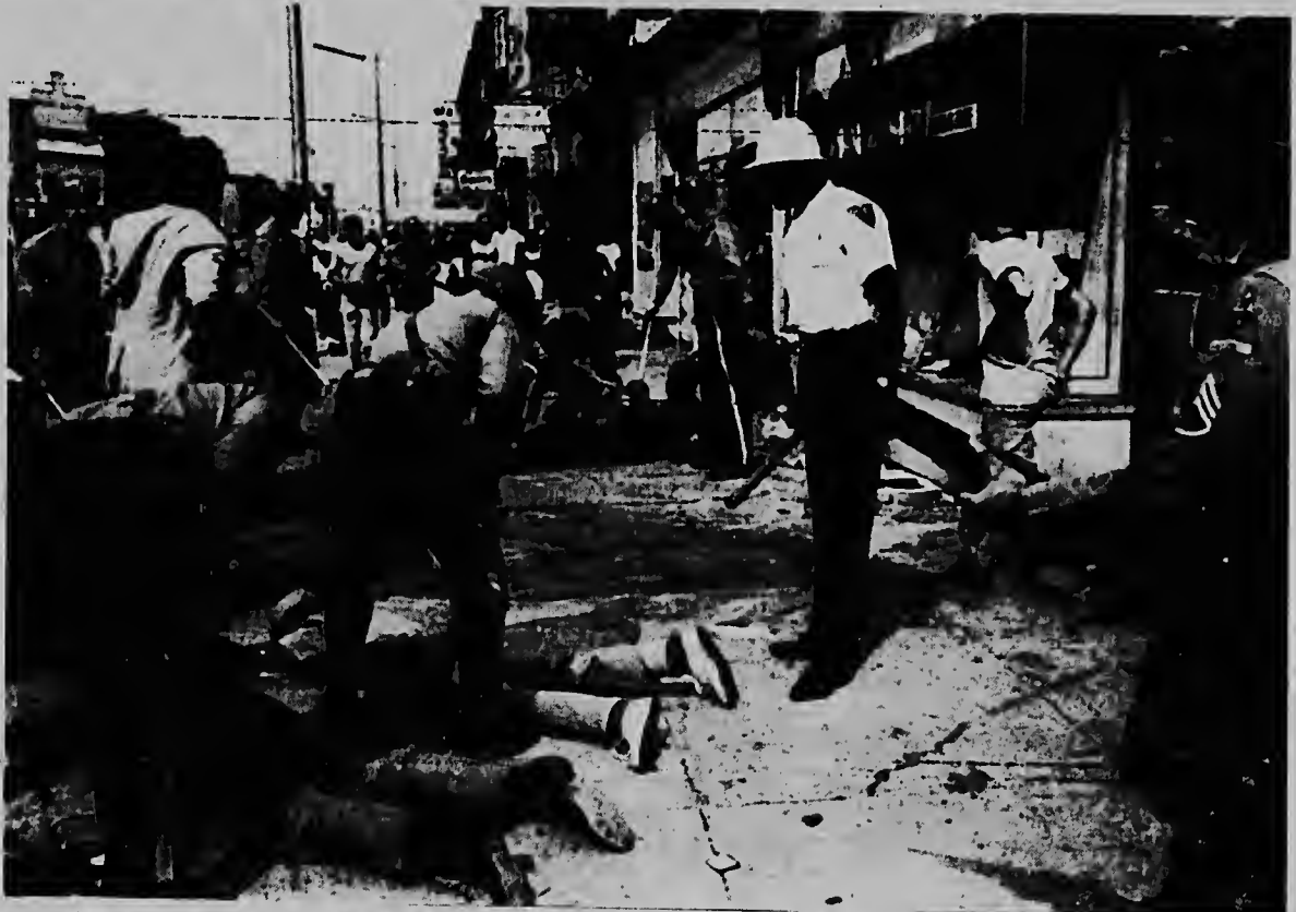
Miembronan di Guardia Nacional y polis estatal aki ta vigilando un grupo di elementonan qu a ataca e pacusnan di Newark y a hisa tur loque tabatin den nan bai cune. E ataquenan riba pacusnan a sosode durante e segundo anochi di violencianan racial na e ciudad aki.

E portavoz a bisa cu no tabatin perdida entre e forsanan Jordano, Ela anjadi cu nan a manda un keho urgente na Consejo di Seguridad di Nacionnan Uni.